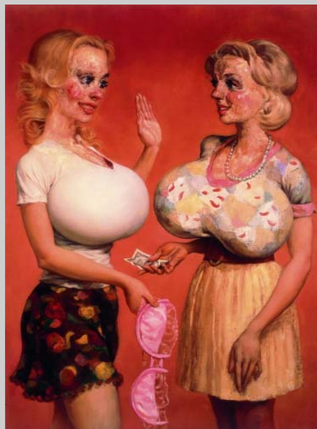
John Currin - Jaunty und Mame, 1997 óleo sobre tela, 121,9 x 91,4 cm The Sander Collection, Berlin