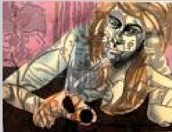
David Salle, "Girl", Óleo sobre tela