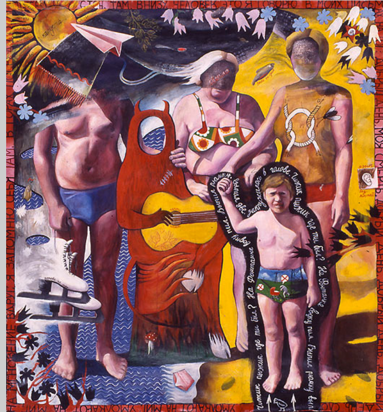
Any Aulinich, óleo sobre tela.