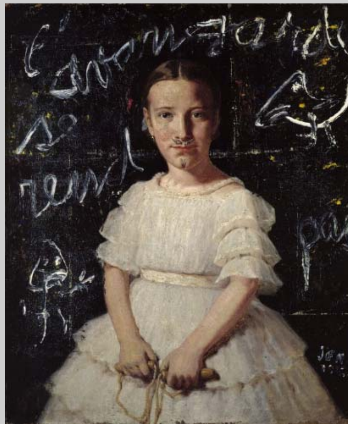
Jorn Asger "L'Avantgarde se rend pas", 1962 Óleo sobre tela, 73 x 60 cm