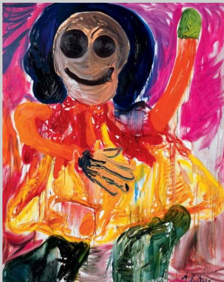
André Butzer Frau, 2002 Óleo sobre tela, 250 x 200 cm