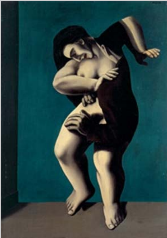
René Magritte "The Titanic days", 1928, óleo sobre tela.

Museum of Modern Art of Vienna ( 4 junio, 2008)